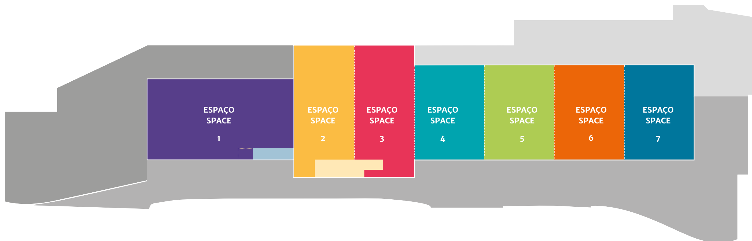
Figura 1 Picture 1

4914 m 2 of large covered area, modular and divisible up to 7 spaces